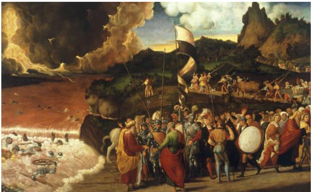
Le désastre des Egyptiens dans la Mer Rouge (1520), Previtali Andrea (1470-1528), Galleria dell'Academia, Venise

Lettre paroissiale hebdomadaire N° 70 17 octobre 2021