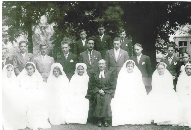
Le 5 juin 1949, dans les jardins du Temple-Neuf.