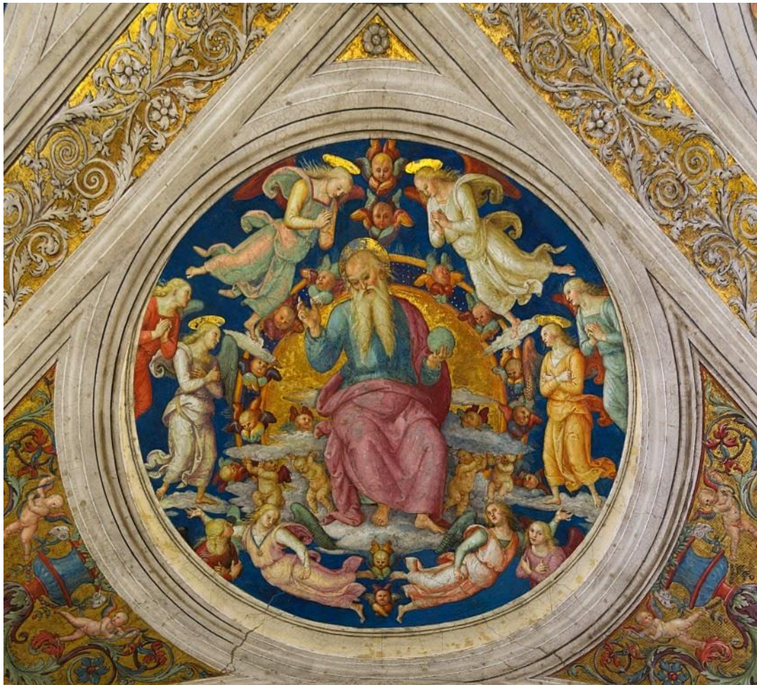
Dieu le Père, Pietro Perugino (1450-1523) , Plafond de la Chambre de l'Incendie de Borgo, Vatican.

Lettre paroissiale hebdomadaire n° 49 - 28 février 2021 -