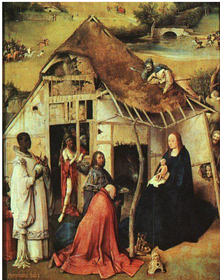
L'adoration des mages, 1496-1497, par Jérôme Bosch, Musée du Prado, Madrid .

Lettre paroissiale hebdomadaire n° 41 - 3 janvier 2021 - EPIPHANIE-