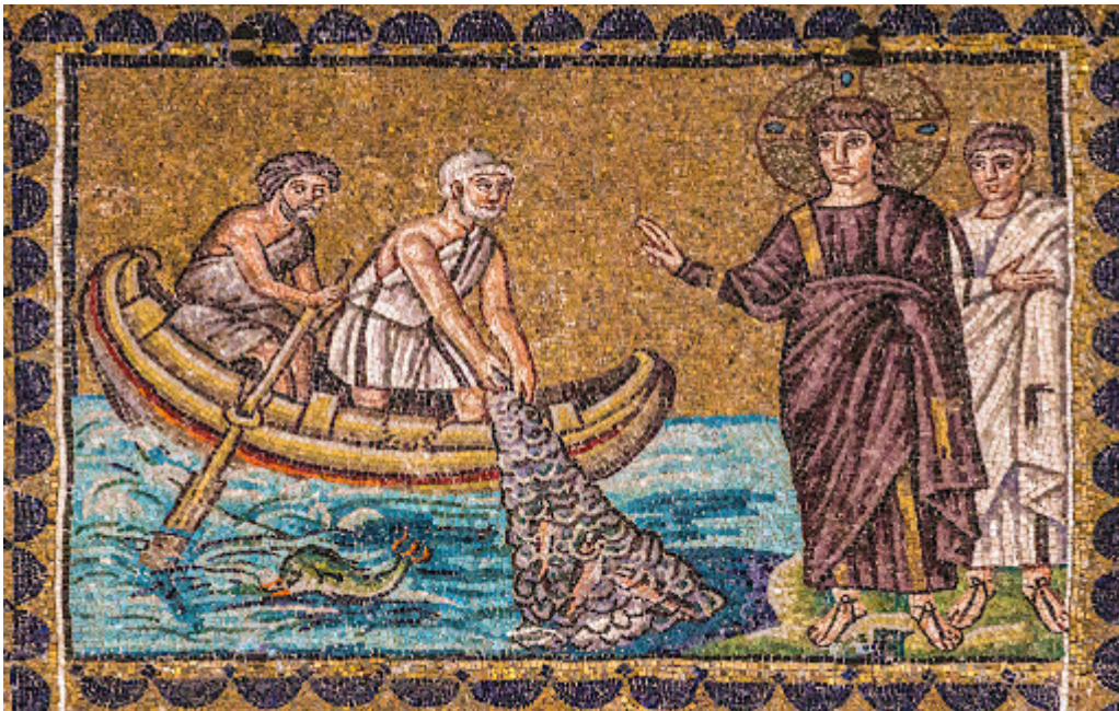
Mosaïque de Saint Apollinaire-Le-Jeune, Ravenne

“1 ¶ Comme la foule se pressait autour de lui pour entendre la parole de Dieu, et qu’il se tenait près du lac de Génésareth, 2 il vit au bord du lac deux bateaux d’où les pêcheurs étaient descendus pour laver leurs filets. 3 Il monta dans l’un de ces bateaux, qui était à Simon, et il lui demanda de s’éloigner un peu du rivage. Puis il s’assit, et du bateau il instruisait les foules. 4 Lorsqu’il eut cessé de parler, il dit à Simon : Avance en eau profonde, et jetez vos filets pour pêcher. 5 Simon lui répondit : Maître, nous avons travaillé toute la nuit sans rien prendre. Mais, sur ta parole, je vais jeter les filets. 6 L’ayant fait, ils prirent une grande quantité de poissons : leurs filets se déchiraient. 7 Ils firent signe à leurs associés qui étaient dans l’autre bateau de venir les aider. Ceux-ci vinrent et remplirent les deux bateaux, au point qu’ils enfonçaient. 8 Quand il vit cela, Simon Pierre tomba aux genoux de Jésus et dit : Seigneur, éloigne-toi de moi : je suis un homme pêcheur. 9 Car l’effroi l’avait saisi, lui et tous ceux qui étaient avec lui, à cause de la pêche qu’ils avaient faite. 10 Il en était de même de Jacques et de Jean, fils de Zébédée, les compagnons de Simon. Jésus dit à Simon : N’aie pas peur ; désormais ce sont des êtres humains que tu prendras. 11 Alors ils ramenèrent les bateaux à terre, laissèrent tout et le suivirent.”